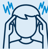
Lesión en la cabeza